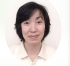
旅川デイサービスセンター 土居所長

新年明けましておめでとうございます。日頃より旅川デイサービスをご利用下さり、ありがとうございます。