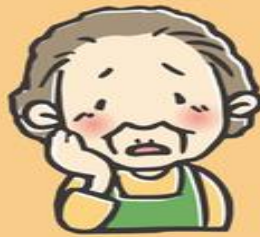
ご利用者 (要介護1～5の方)