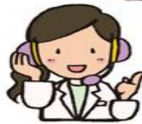
オペレーター (看護師・介護福祉士)