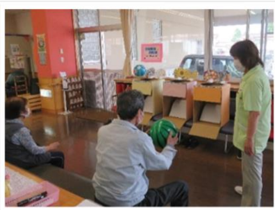
ビーチボールバスケット