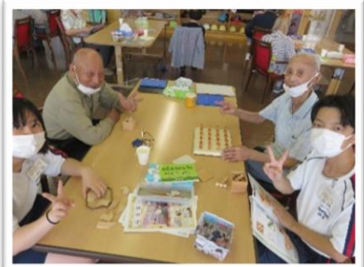
14歳の挑戦の中学生と