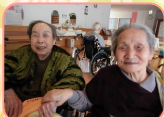
気の合う友人もできました

たまに旅行に行ったことかなあ。立山、九州、三原山、京都と色々な所に行ったよ。そういえば、夜行列車で東京に行った時に、上野の駅で降りて皆で新聞広げておにぎり食べようとしたけど、次の列車に乗らんなんがや食べとる暇ないぞ！と言われて大笑いした。