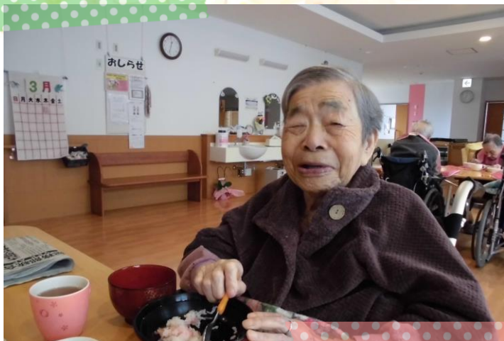
私はちらし寿司を食べて