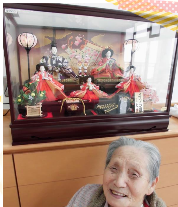
私はお雛さまと写真撮影して