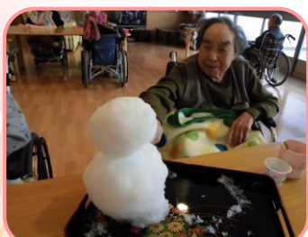
雪だるまを曲ってピョク!!