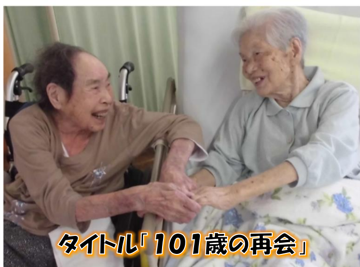
タイトル「101歳の再会」

今年の子年です。福寿園の在宅サービスご利用者の中で子年を迎えられる九十六歳の方々です。