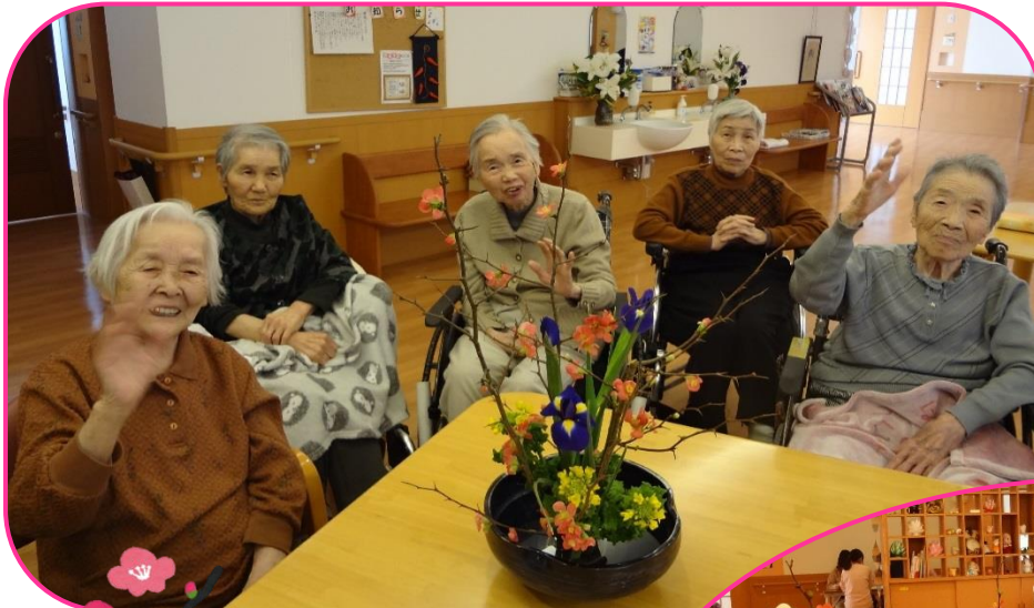
春清フロア：生け花