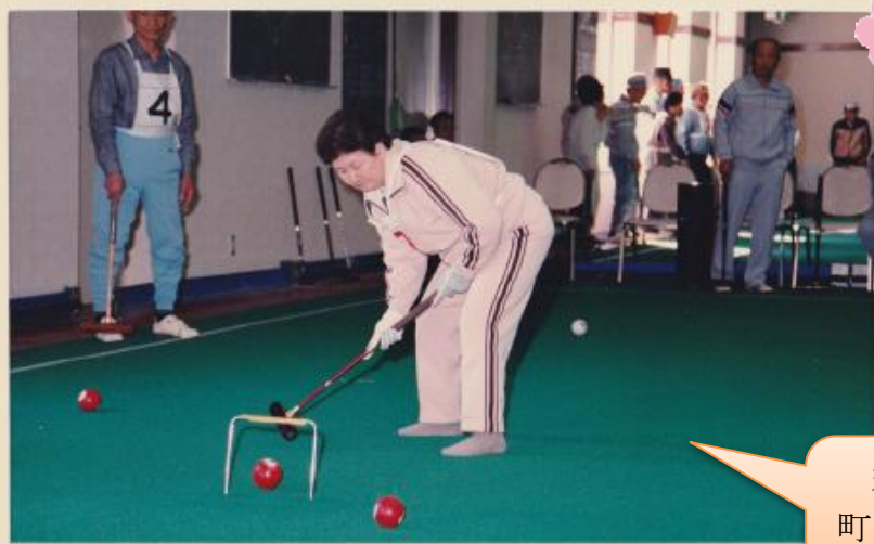
ゲートボールのつどい 中富郡ポータル