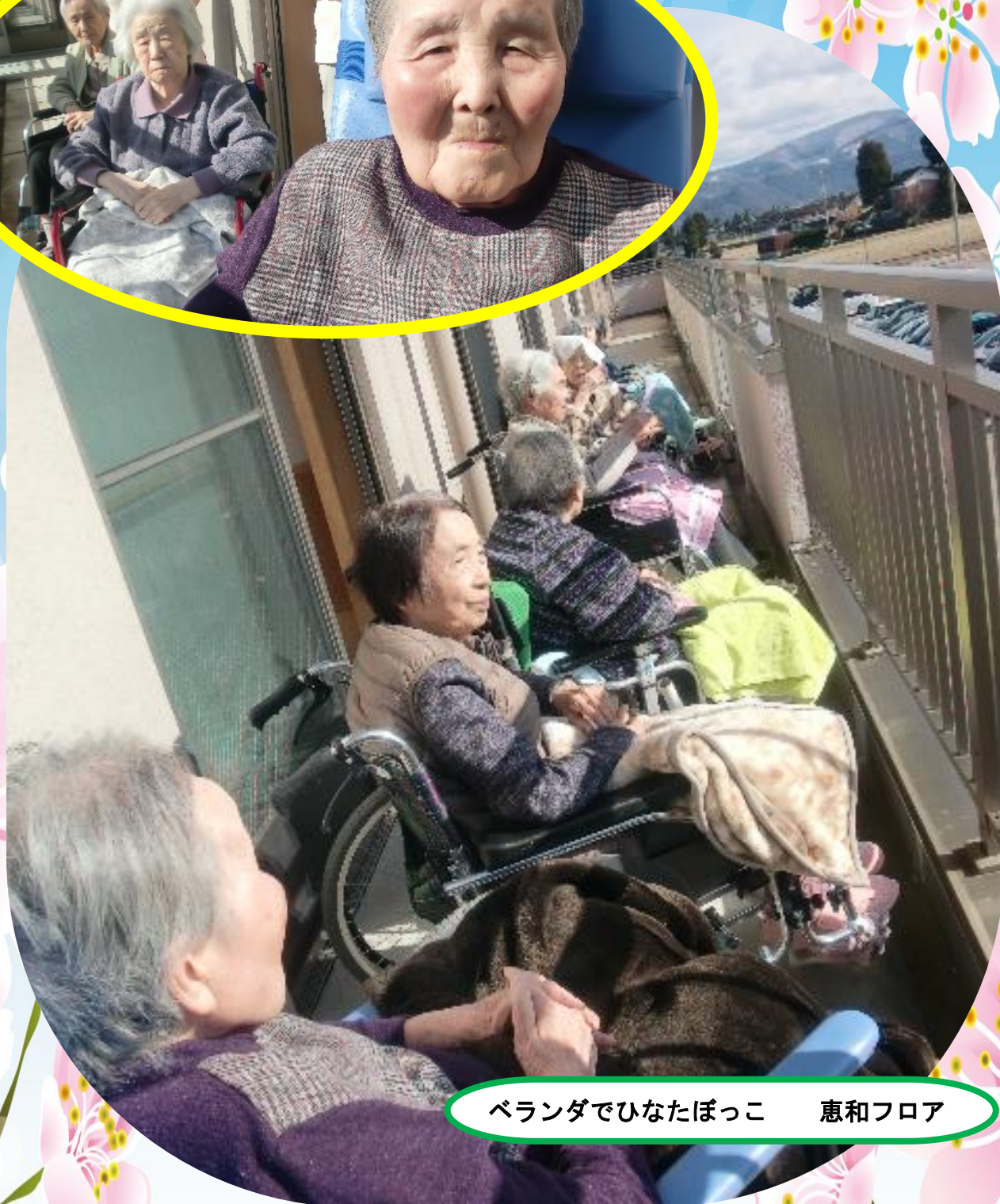
ベランダでひなたぼっこ 恵和フロア