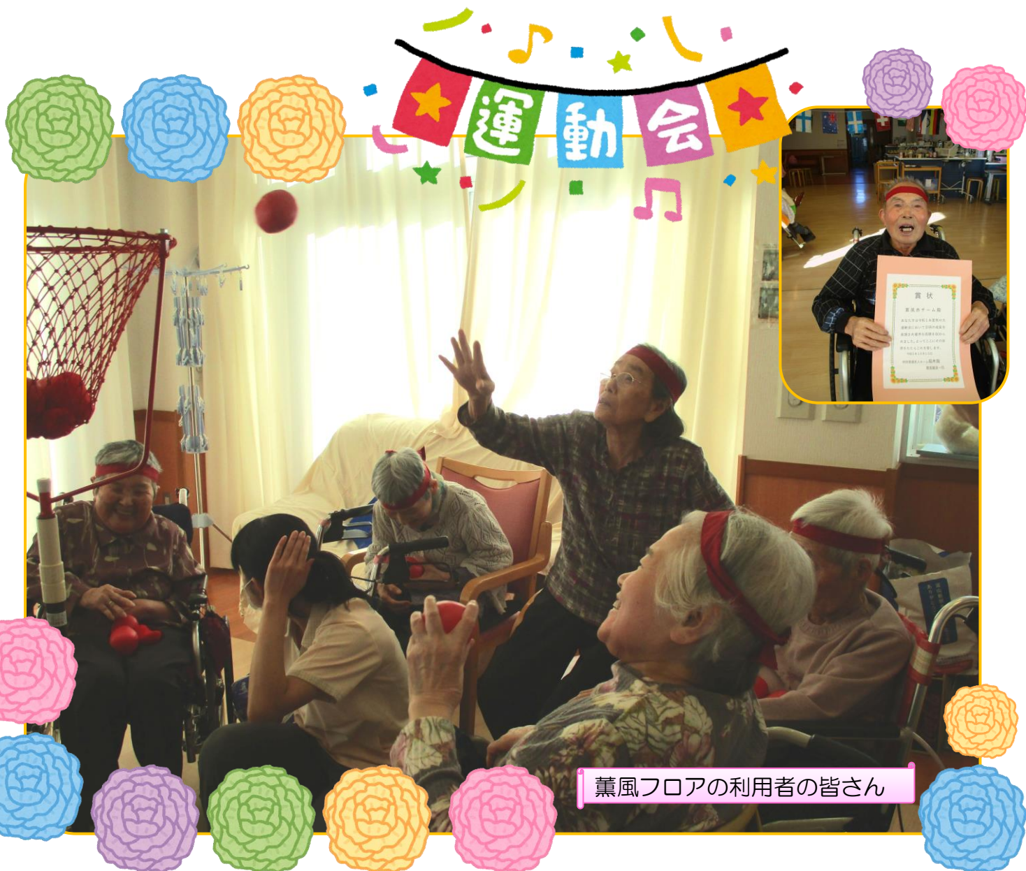
薫風フロアの利用者の皆さん