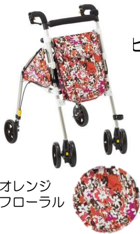
オレンジ フローラル