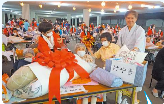
じゃんけん大会、豪華賞品が当たりました!