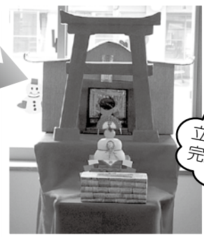
立派なお社の完成です♪