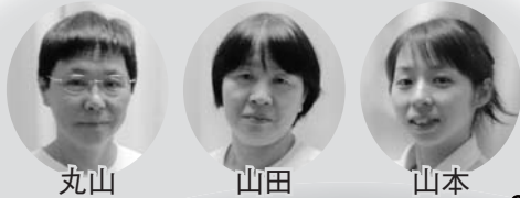
☆看護職員/機能訓練指導員☆