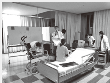
移乗場面での困難事例検討会！ ポイントを再確認し、グループで検討。 発表まで行いました。 『伝える』って難しい。発表が超難関です。