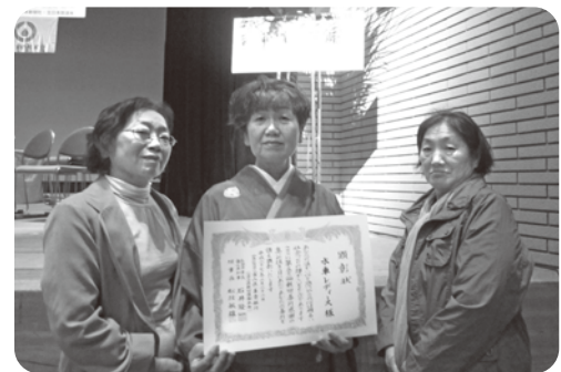
10年節目表彰の受賞者を代表された 水車レディース様