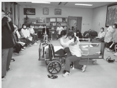
移乗用シートやボードを活用した移乗方法を習得しました