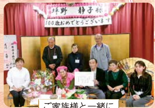
ご家族様と一緒に