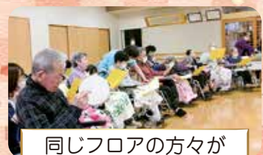
同じフロアの方々が 歌でお祝いされました