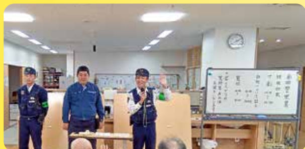
警察署の方の寸劇