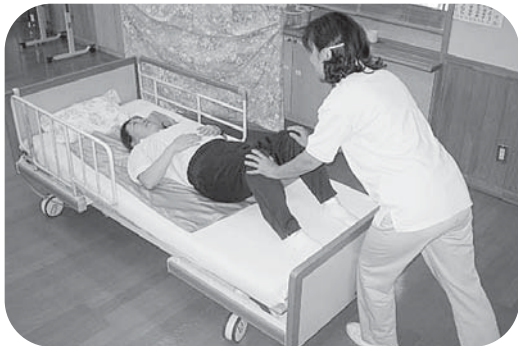
シートは、簡単に体の下に入ります。

スライディングシート(三層構造)を使うとベッド上の座位保持や車椅子への回転など体位変換が楽ですよ!