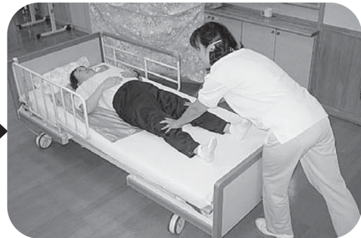
わずかな力で動きます。

上下左右・回転等、さまざまな体位変換や移動をわずかな力でいれ、介護する方・される方の負担を軽減します。