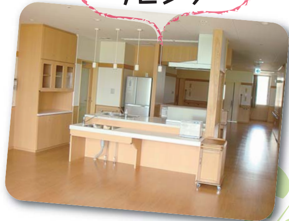
ユニット リビング

広々としたリビングにはキッチンがそなえつけられています。皆さんと一緒に料理をつくったり、盛りつけたり、ごはんを作るのが楽しくなりますね。居室も、皆さんの個性あふれるお部屋になっていくのが楽しみです。