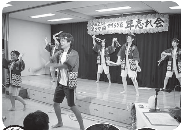
職員出し物テーマ「祭り」