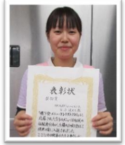
奨励賞を受賞した「ゆうびす」