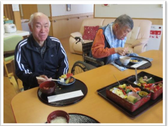
やすらぎ荘特製おせち料理です。豪華なおせちに思わずニヤリ！