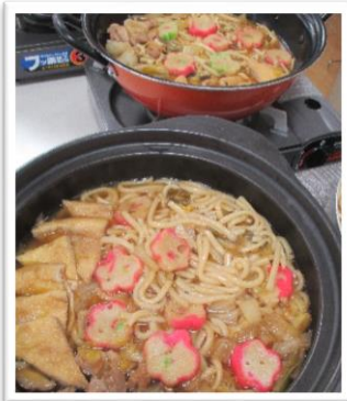
煮込みうどん会食