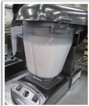
ミキサーでトロトロにしています。