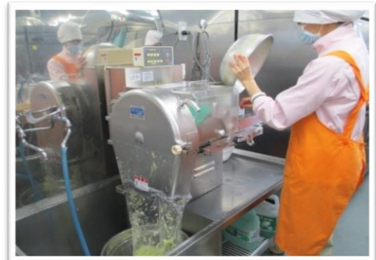
野菜を機械にかけています