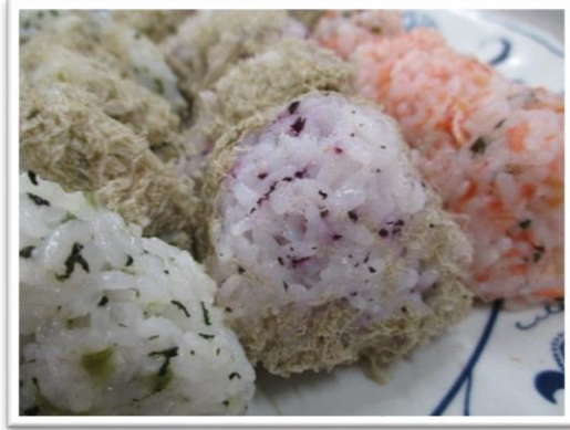
おにぎりバイキング