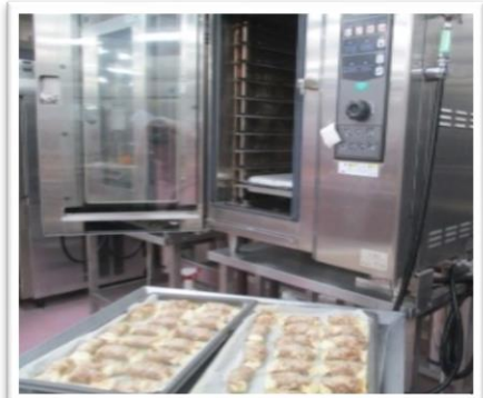
スチームコンベクションです。魚や肉を焼いたり、野菜や煮物を軟らかく煮たりと色々な調理が出来ます。