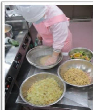
サラダを和えてます