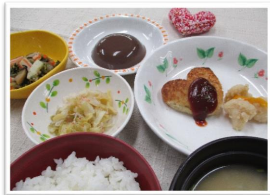
バレンタインデー膳