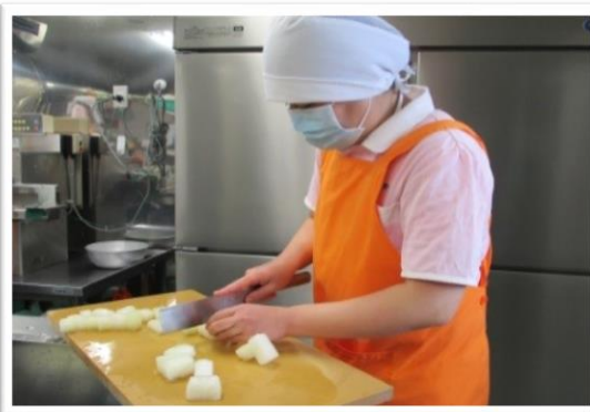
野菜を切っています