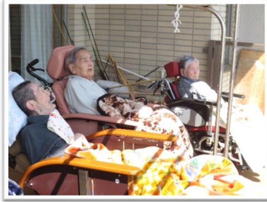
ベランダに出て日向ぼっこ～春ですね～