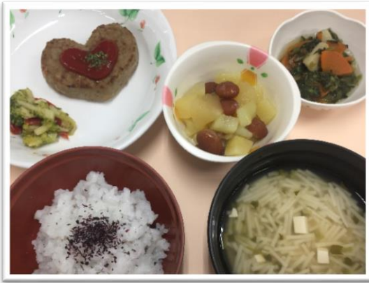
ホワイトデーランチ