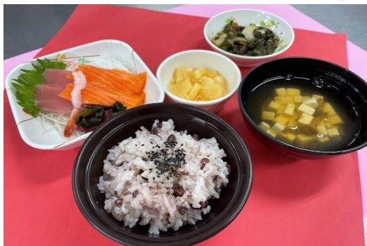
2月の行事食 ～赤飯と刺身～